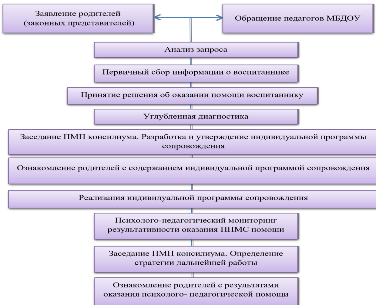
Схема-алгоритм оказания психолого-педагогического сопровождения воспитанников, испытывающим трудности в освоении образовательной программы, развитии и социальной адаптации.